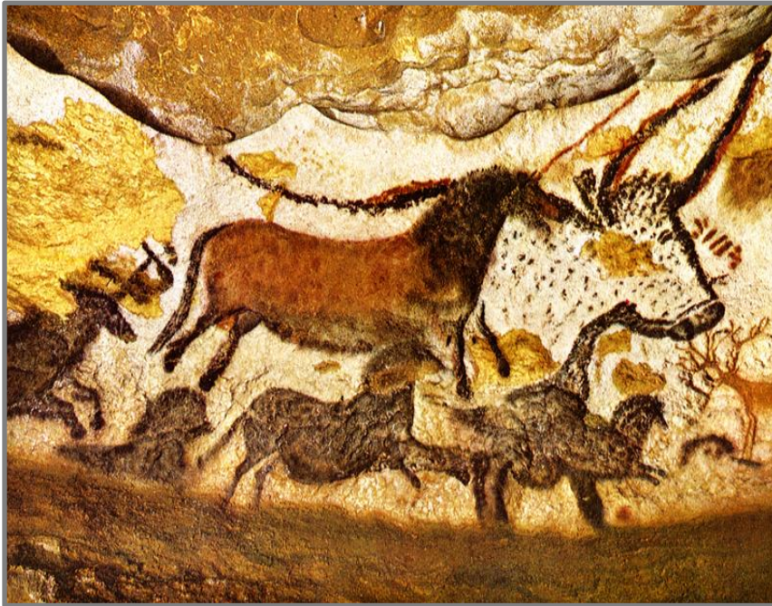
Photo de la Salle des Taureaux , Grotte de Lascaux, Dordogne, France