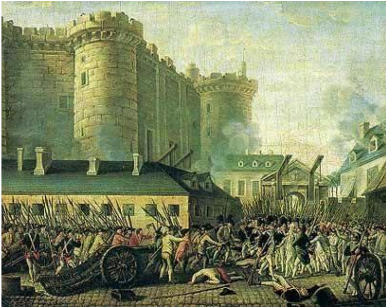
Anonyme, La prise de la Bastille , 1789

a- A ton avis, ce document est-il un dessin ou une photo ?