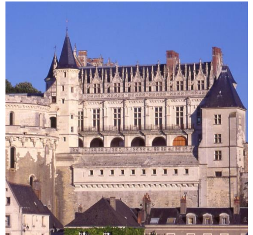
Le château d'Amboise

1. Quand les rois de France viennent-ils s'installer dans la vallée de la Loire ?