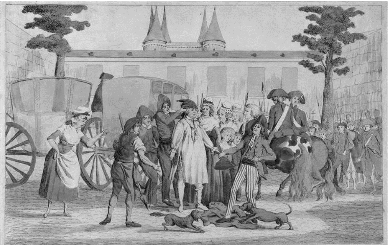
LOUIS LE DERNIER ET SA FAMILLE CONDUITS AU TEMPLE le 13 - Août 1793.