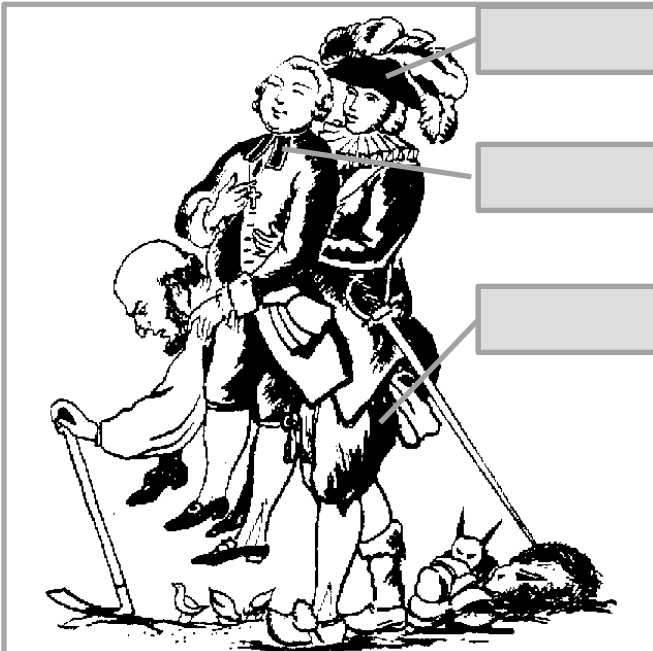
Caricature de 1789, gravure.