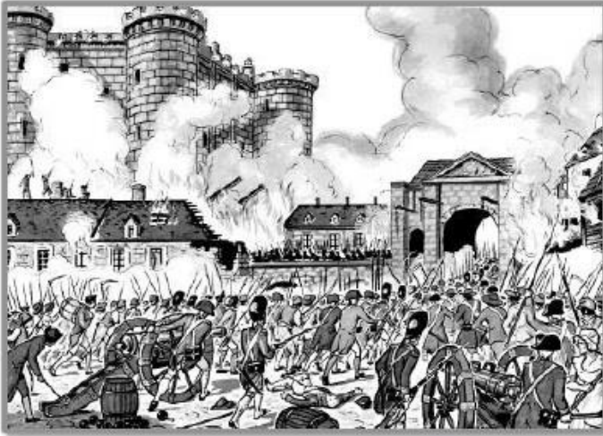
La prise de la Bastille, le 14 juillet 1789.