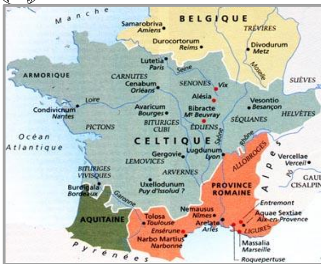
La Gaule au 1 er siècle avant JC