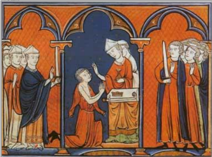
Le ..... de Louis IX, miniature du manuscrit de l'Ordo du sacre de 1250