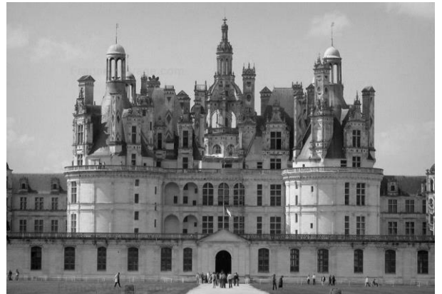
Le Château de Chambord.