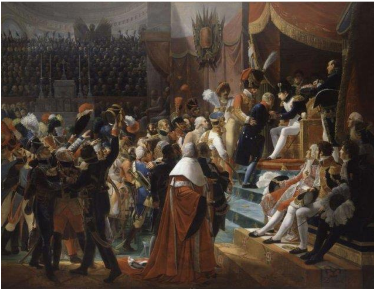
Première distribution des croix de la Légion d'honneur, 14 juillet 1804, par Jean-Baptiste Debret, 1812. Huile sur toile, 403 x 531 cm, Château de Versailles