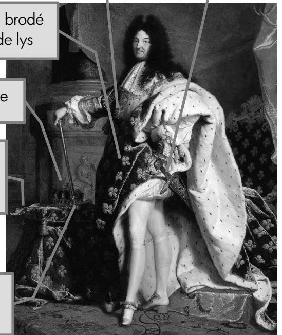
Louis XIV en costume de sacre, Hyacinthe Rigaud, 1701.