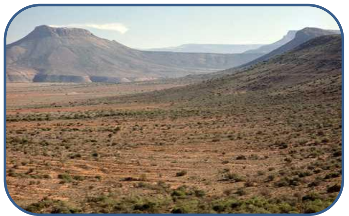
Un plateau en Afrique du Sud