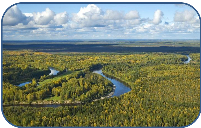
La grande plaine de Sibérie (Russie)

L'absence de pentes facilite la mise en culture, l'installation des villes et des voies de communication.