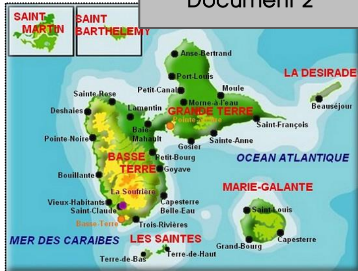
Carte de la Guadeloupe