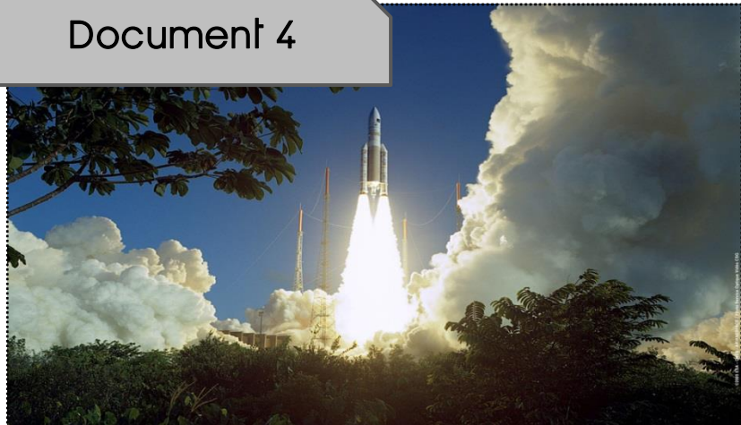
Kourou, 12 février 2005 : vol 164 d'Ariane 5