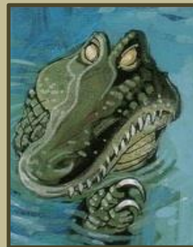
Le crocodile marin