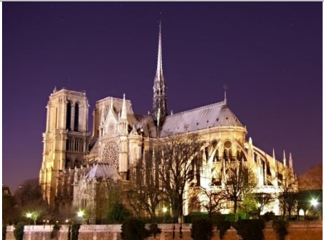
Notre Dame de Paris

2 Indique si les monuments suivants appartiennent à l'art ROMAN ou GOTHIQUE : 15