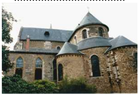
Notre-Dame du Pré au Mans