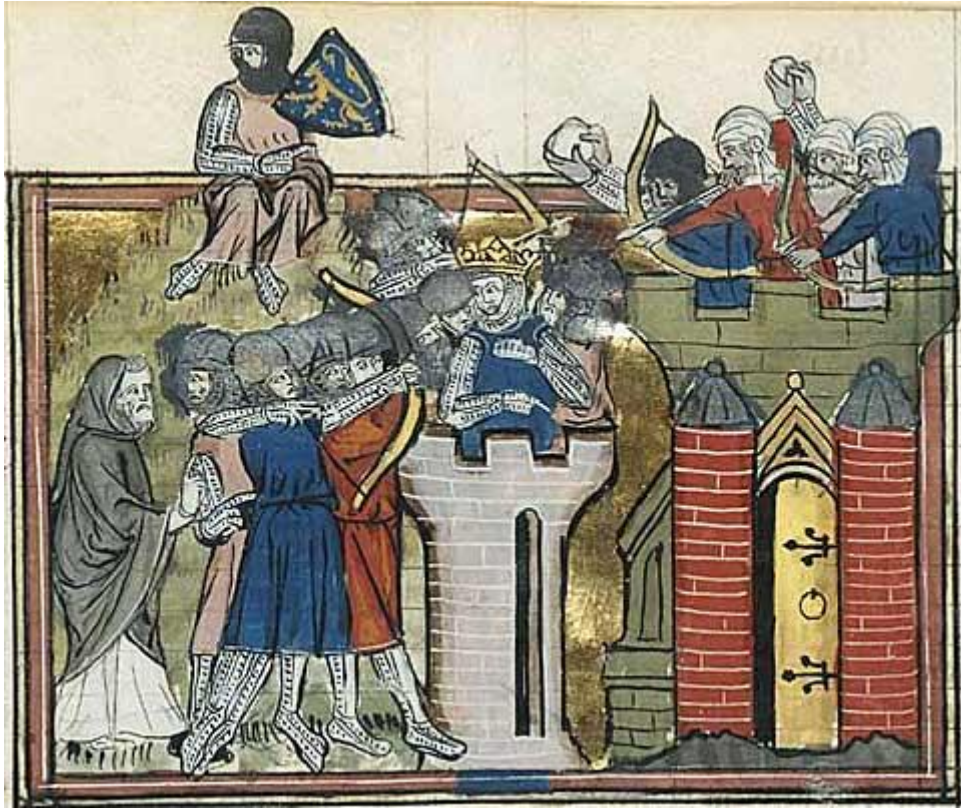
Roman de Godefroi de Bouillon et de Saladin. Manuscrit enluminé sur parchemin.

1. Qui demande au roi d'envoyer des chrétiens prendre Jérusalem ?