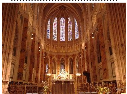
La cathédrale de Chartres