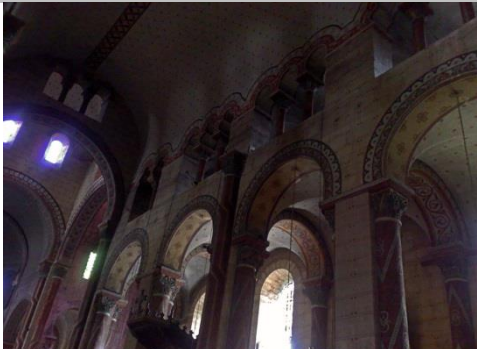
Saint Austremoine d'Issoire