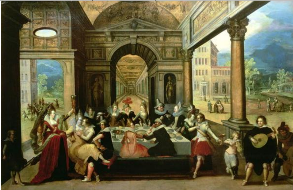
Louis de Caullery, La Parabole de l'enfant prodigue , début du XVII ème siècle