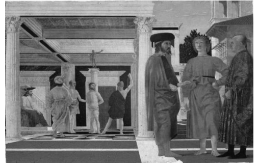
Piero della Francesca, La flagellation du Christ , 1444.