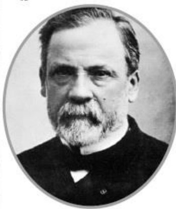
Louis Pasteur (1822-1895)