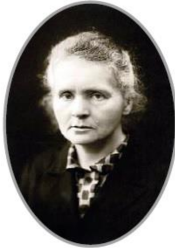
Marie Curie (1867-1934)