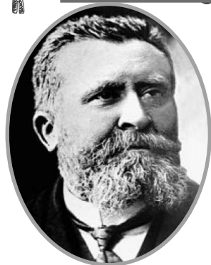
Jean Jaurès (1859-1914)

Pendant la révolution industrielle, une nouvelle catégorie de travailleurs s'est développée : celle des ..... Ceux-ci travaillent tous les jours, 12 à 15 heures par jour, sans vacances, pour des ..... très bas qui leur permettent à peine de survivre. Le travail est ....., souvent dangereux, et la discipline est sévère : les maladies et accidents de travail sont nombreux. Ceux qui se plaignent sont renvoyés. Ils vivent pauvrement dans de petits ..... insalubres et mal chauffés. Leurs conditions de vie s'améliorent au cours du siècle. Au cours du XIX ème , la grande ....., constituée de banquiers et d'industriels, s'est beaucoup ..... Ils habitent dans de luxueux hôtels particuliers dans les grandes villes. Ils emploient de nombreux ..... Les grands bourgeois occupent les principales fonctions ..... La classe moyenne est constituée de la petite et la moyenne bourgeoisie (médecins, magistrats, ingénieurs, enseignants, employés...). Leur niveau de vie est plus modeste : ils sont attachés au travail, à l'épargne, à la propriété, à l'ordre et ont le désir de s'élever socialement.