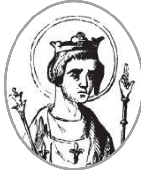
Louis IX (Saint Louis)