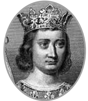
Philippe le Bel