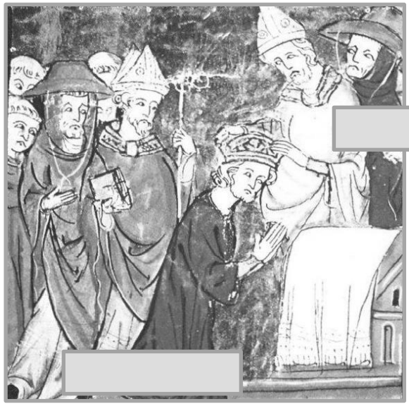
Le couronnement de Charlemagne