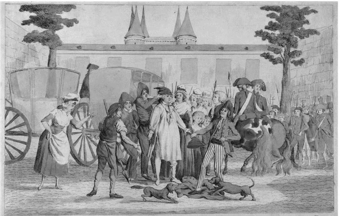
J. LOUIS LE DERNIER ET SA FAMILLE CONDAMNÉS AU TEMPLE