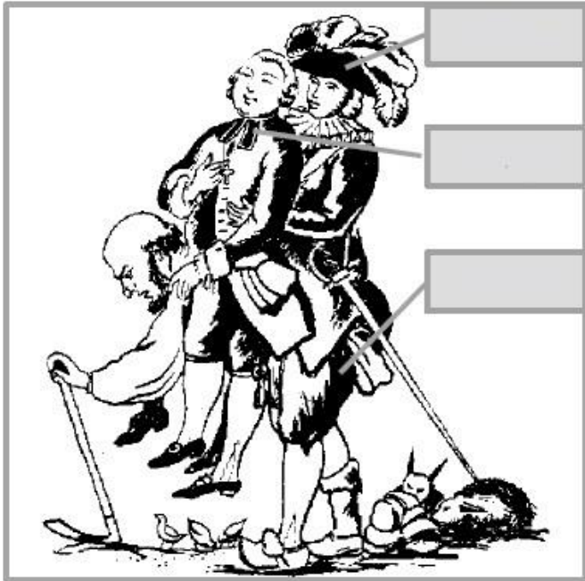
Caricature de 1789, gravure.