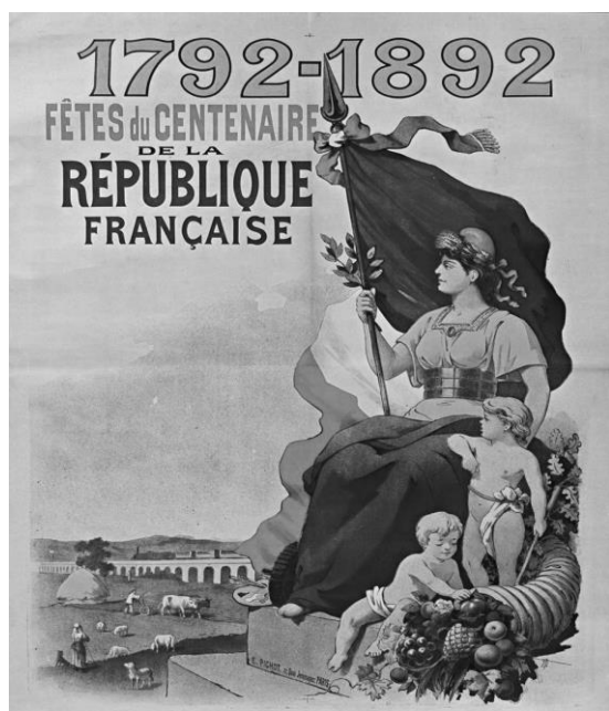
E. Pichot, affiche, 1892.