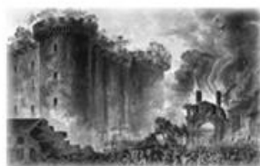
La fête nationale