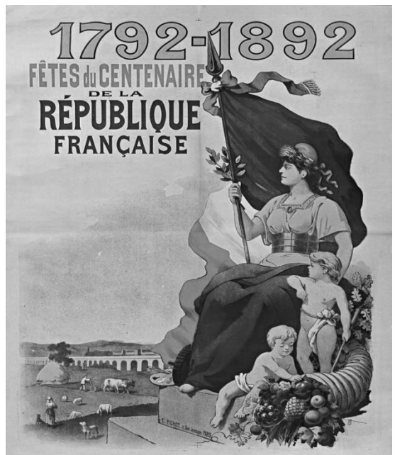
E. Pichot, affiche, 1892.