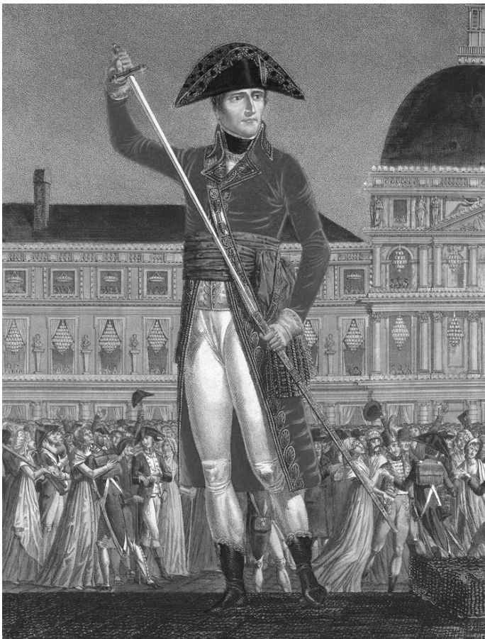
Alexis Chataignier, Bonaparte, Premier Consul, remettant l'épée dans le fourreau après la paix générale, 1802.