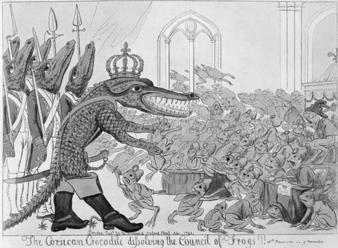
Le coup d'état du 18 brumaire par un artiste anglais : Le crocodile corse achève le Conseil des Grenouilles