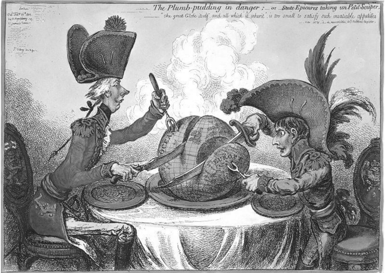
James Gillray, Le Pudding en danger, ou, des états épicuriens prenant un « petit souper » , 1805.

L'homme à gauche est William Pitt, un homme politique anglais. Il est assis à une table avec Napoléon. Les deux personnages se partagent un grand pudding aux fruits secs portant un carte du monde. Le nouvel empereur, et son opposant le premier ministre anglais, se partagent le monde.