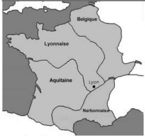
La Gaule romaine