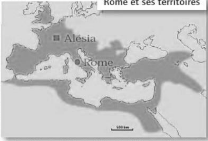
Rome et ses territoires