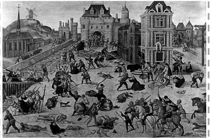
Le Massacre de la Saint Barthélémy, .....